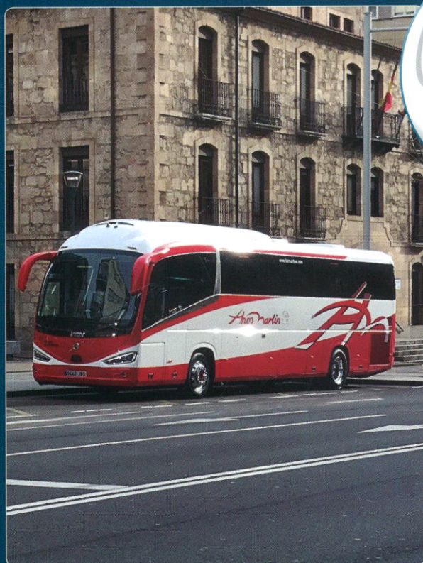
PYME-TRANSPORTE REGULAR Autocares Hermanos Martín