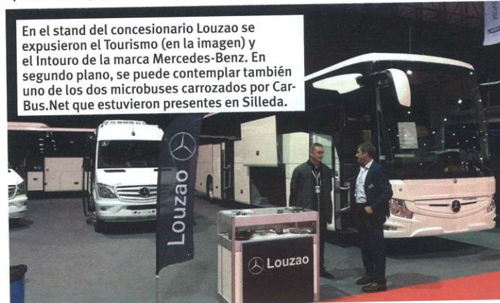
En el stand del concesionario Louzao se expusieron el Turismo (en la imagen) y el Intouro de la marca Mercedes-Benz. En segundo plano, se puede contemplar también uno de los microbuses carrozados por Car-Bus.Net que estuvieron presentes en Silleda.