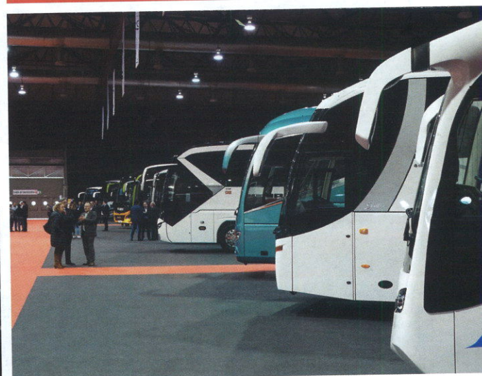
Siguiendo la estela del salón Nortrans de Ourense, la marca MAN realizó un espectacular despliegue con una docena de vehículos que ocupaban el fondo entero del pabellón ferial. Allí se pudieron contemplar diversas propuestas de autocares integrales (con especial mención al Tourliner de Neoplan y al Lion's Coach de MAN), pero también de vehículos carrozados por Beulas, Castrosua, Irizar o Sunsundegui.