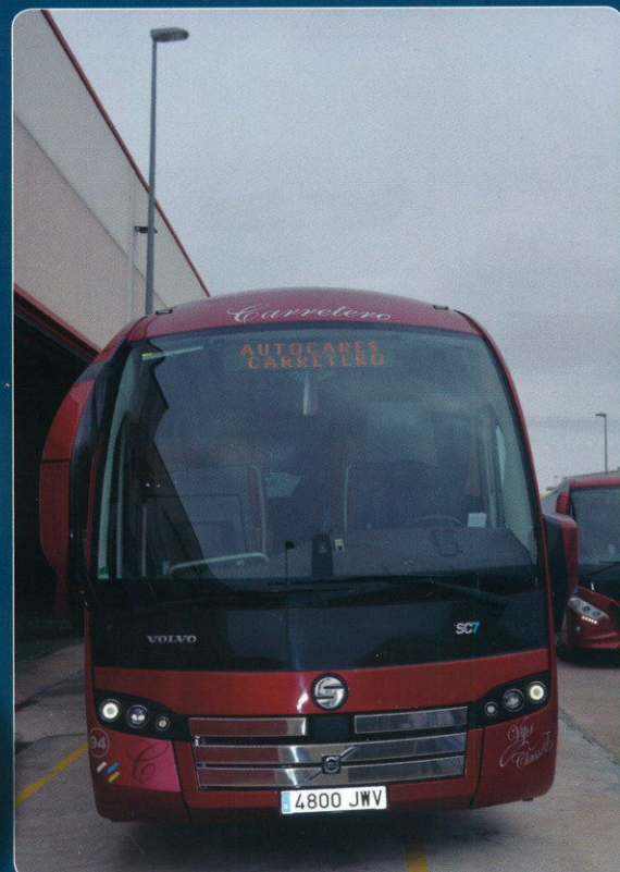
TRANSPORTE DISCRECIONAL Autocares Carretero