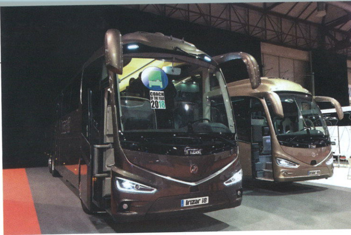
Uno de los grandes atractivos de la muestra gallega fue el autocar Irizar i8, elegido Coach of the Year 2018 en Europa. Además, el fabricante vasco expuso dos unidades diferentes del autocar integral i6S.