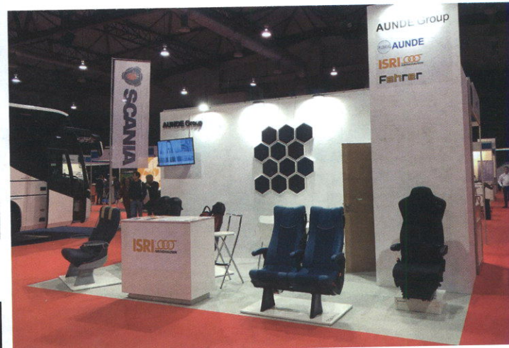
La empresa Isri llevó hasta su stand el modelo Ega Sport, el Irati con cargador USB, la novedad del Civic también con USB y el Ega Relax provisto de monitores y porta-tabletas. Además, expuso el asiento de conductor NTS2 con calefacción y ventilación, que fue presentado en 2017.