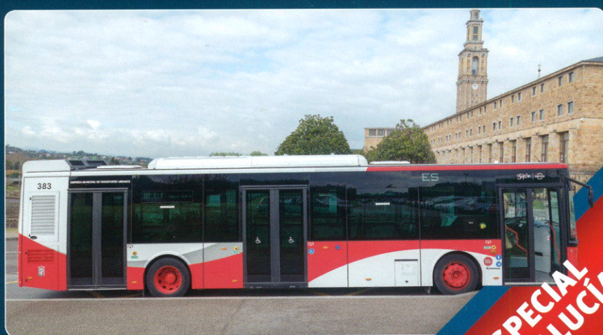
TRANSPORTE URBANO EMTUSA de Gijón