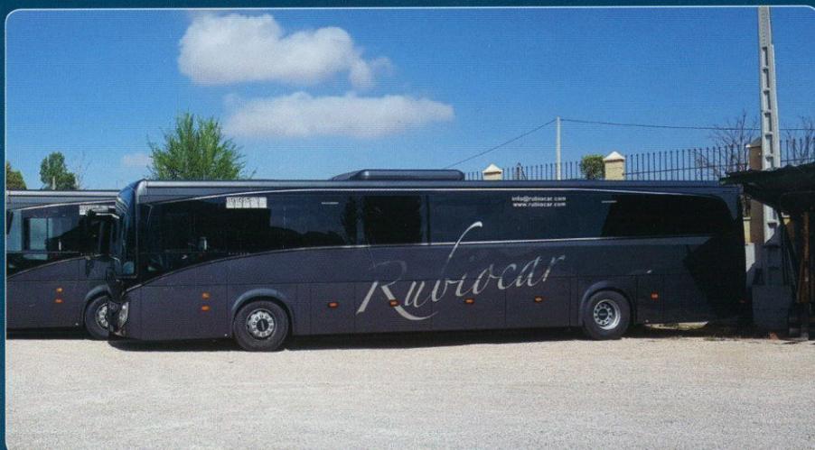
TRANSPORTE REGULAR Autolíneas Rubioicar

www.autobusesyautocares.com @autobusesyautoc