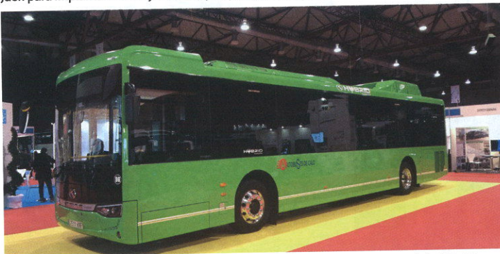
El fabricante asiático King Long llamó la atención por exponer un autobús híbrido adquirido por la empresa coruñesa Autobuses de Calo. En otra zona de la feria estaban presentes también los modelos C10, C12 y C12HD, todos ellos vendidos a operadores españoles.