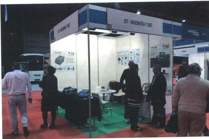
La firma IST Ingeniería y Sistemas presentó el Modelo Halcón, una expendedora y validadora que acepta tarjetas y lleva un lector para móviles. Además, lleva incorporada una terminal para el pago con tarjeta bancaria y controla los letreiros externos y el conteo de viajeros. En su stand se informó también que han ganado un concurso del Consorcio de Jaén para implantar el SAE y las ventajas que ofrecen sus nuevos terminales portátiles.