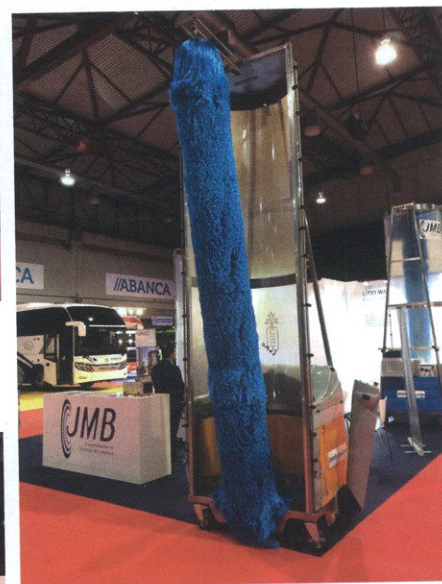
El grupo vasco JMB llevó hasta su stand el monocepillo Lítio Wash para el lavado de pequeñas y grandes flotas. Se trata del único monocepillo en el mundo que posee una batería de litio, que se caracteriza por ser ecológico, de carga rápida, sin mantenimiento, silencioso, con depósito de agua incorporado, 100% móvil y realizar la limpieza del autobús en apenas dos minutos.